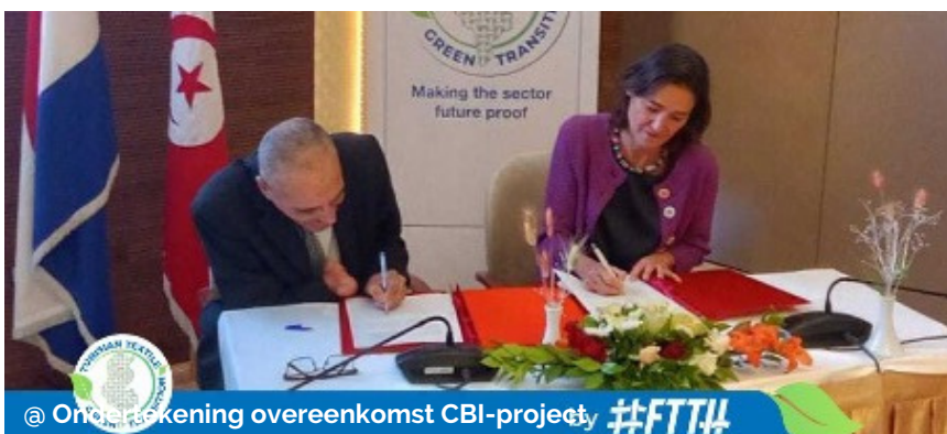
@ Ondertekening overeenkomst CBI-project #FTT4

Ondanks geharmoniseerde standaarden blijft maatinconsistentie een probleem. Maat L van merk X komt vaak niet overeen met dezelfde maat van merk Y. Soms verschillen zelfs items van hetzelfde merk. TMO Fashion Business School deed in opdracht van Modint onderzoek naar dit probleem.